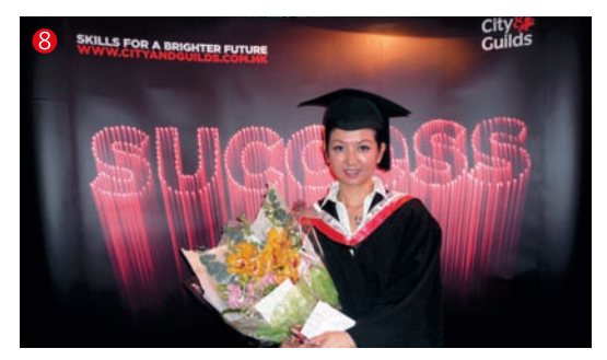
有關高等資格頒授典禮及相關資料,歡迎瀏覽 www.cityandguilds.com,hk/cg/news.html 如想進一步了解更多資料,歡迎致電本會。